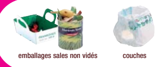
emballages sales non vidés