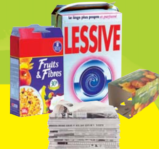
Cartons, cartonnettes, journaux, magazines

LE RESTE > à jeter dans votre poubelle habituelle en sac