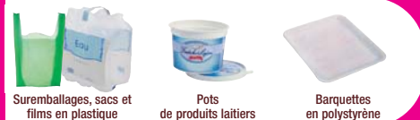
Suremballages, sacs et films en plastique

LE RESTE > à jeter dans votre poubelle habituelle en sac